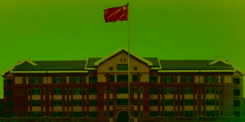
天津机电职业技术学院

TIANJIN VOCATIONAL COLLEGE OF MECHANICAL AND ELECTRICAL ENGINEERING